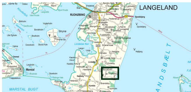
© Kort & Målestyrelsen (G. 21-01)

Stien over Påo Enge er et af de 5 spor, der fører gennem herregårdsskabet på Danmarks Naturfond's økologiske herregård Skovsgaard på Langeland. Skovsgaard ligger ca. 13 km syd for Rudkøbing. Fra Lindelse køres mod øst til Hennemved, hvorfra der er skiltning til Skovsgaard. Stien udgår fra P-pladsen ved stranden for enden af Kågårdsvej ca. 2,5 km øst for Skovsgaard. Den grønne firkant svarer til rutekortet på undersiden.