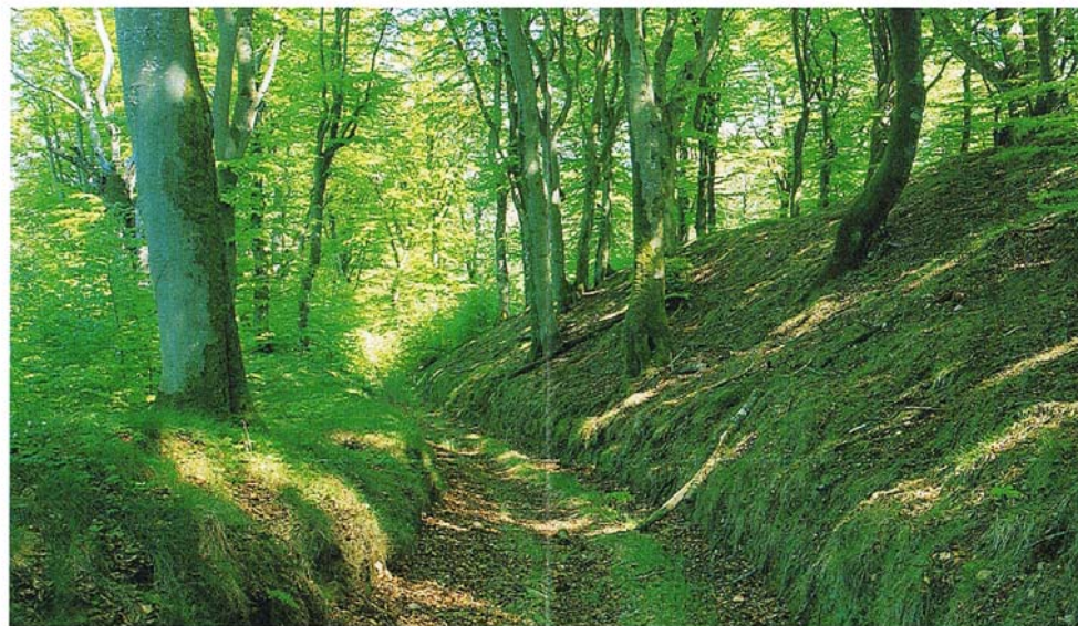
Århundredes kørsel med korn ned til vandmøllen ved Sønderup Å har sat sine markante spor som dybe hulveje.

Tekst: Skovrider H. Staun · www.SvendborgTryk.dk Udgivet med støtte fra Skov- og Naturstyrelsen · 2007