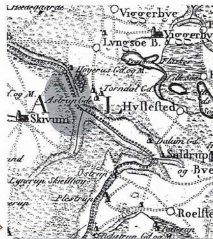
I 1791 var området præget af store, spredt bevoksede hedestrukturer. Videnskabernes Selskabs kort 1791.

De nye tider med udskiftning og skovindfredning omkring år 1800 bevirkede, at hede- og overdrevsarealerne langsomt skiftede karakter og efter fællesskabets ophør blev lagt til de enkelte gårde. Afgræsningen mindskedes, men ophørte ikke, træerne fik fred og kunne vokse op. Og da egen tåler kreaturers stadige nedbidning,