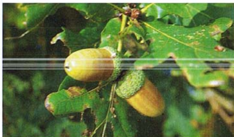
Egene i Højris Mølle er stike af den oprindelige jyske form.

Naturfonden har derfor siden erhvervelsen udarbejdet en detaljeret plejeplan for ejendommens drift for at sikre og bevare både de natur- men også de kulturhistoriske værdier, der knytter sig til stedet i så rigt mål.